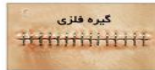
انواع بستن محل برش عمل جراحی